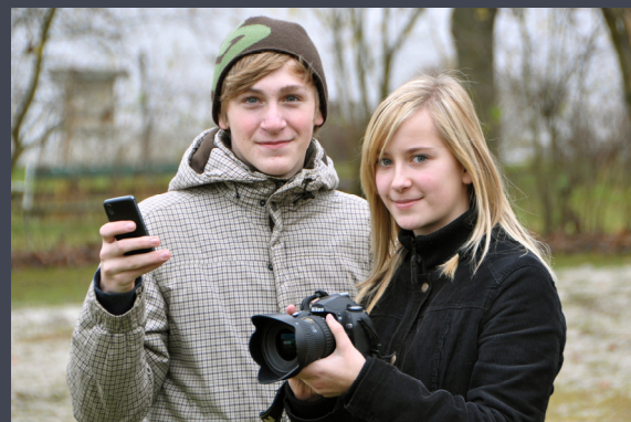
Foto Kücher, Salzburg Coffee2watch, Salzburg Foto & Grafik Edwin Heger, Zell am See, Salzburg Intersport Pirchner, Rauris, Salzburg Sport Wielandner, St. Johann in Pongau, Salzburg