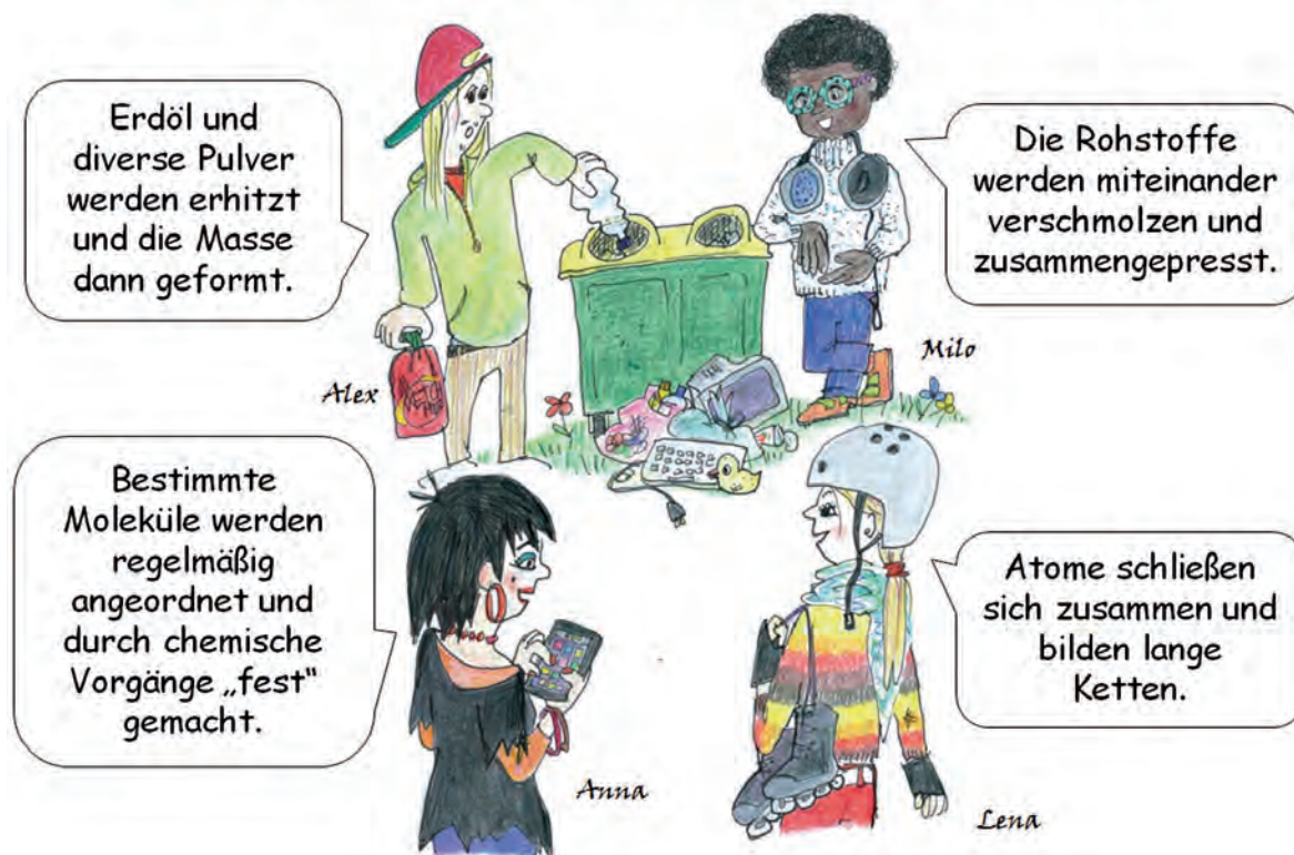
Abb. 1: Concept Cartoon zur Frage ‚Wie werden Kunststoffe hergestellt?‘