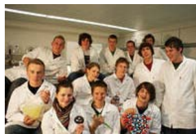
Junge Forscher aus Ursprung